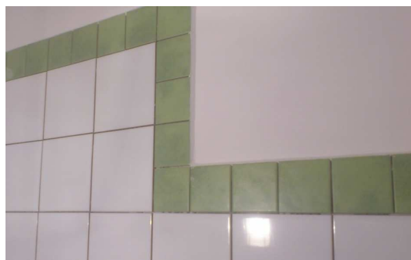
Fot. Glazura na ścianie jednej z remontowanych łazienek

Ze ścian usunięta została stara glazura, zdemonstrowana kilkudziesięcioletnia armatura sanitarna i zdemonstrowane drzwi wraz z ościeżnicami. Na wyrównane ściany kładziona jest obecnie zebrana podczas trwania akcji ceramika. Po wykonaniu instalacji wodnej i kanalizacyjnej zamontowana zostanie przekazana przez firmę Sanitec Koło armatura: wc, umywalki, brodziki i wanny. Krany, baterie natryskowe dostarczyła firma Kludi. Nowo wyremontowane łazienki wyposażone zostaną w meble dostarczone również dzięki uprzejmości firmy Sanitec Koło.