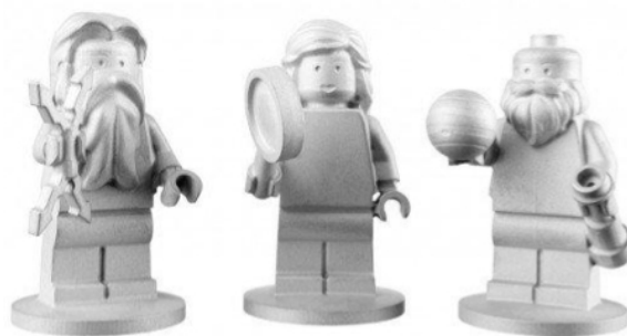
Foto: Aluminiowe postacie mini figurek LEGO: Galileusz, bóg Jowisza i jego żona Junona.

Sam pomysł wysłania tych postaci w kosmos zrodził się w głowach ekspertów z NASA. Współpraca agencji z firmą LEGO ma na celu popularyzację nauki wśród najmłodszych.