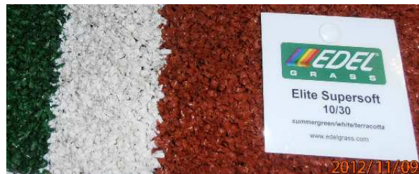
Fot. Nawierzchnia typu „edel grass”

6 listopada pomiędzy Urzędem Miejskim w Łomiankach i biurem architektonicznym podpisana została umowa na wykonanie projektu. Termin zakończenia umowy wyznaczono na 7 grudnia br.