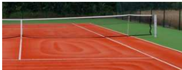
Fot. Nawierzchnia typu „mondo 6615”

Wykonana przez Zespół Architektów i Konstruktorów „arch1.eu” (www.arch1.eu) koncepcja zakłada przygotowanie utwardzonego miejsca parkingowego dla 10 miejsc wraz z miejscem parkingowym dla osób niepełnosprawnych. Zapisano w niej ponadto wybudowanie niewielkiego budynku zaplecza.